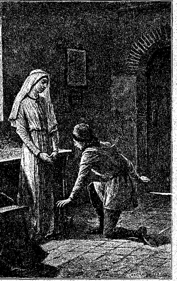
« Δέσποινα! εἶμαι πολὺ δυ.τυχής! » (Σελ. 134, στήλ. 6.)

— Ἀχ, ναί, παιδάκι μου. Ἐβουγε χθές τὸ πρωὶ γιὰ τὴν χώρα. Ἐγὼ δὲν ἤθελα... καὶ εἶχα δέκχο... Νά, πού δὲν ἐφάνηκε ὡς τώρα... Πᾶει ὁ ἀνδρούλης μου! πᾶει!... Ὅθι μού τον ἐσκέτωσαν χωρὶς ἄλλο! — Ἦταν μόνος; — Ὅχι; εἶχε μαζί του τὸ γυιὸ μιᾶς κυρίας, πού κάθεται ἐδῶ ἐντὸ ξενοδοχείῳ μας, ἐντὸ διπλὰν δωμάτιο... — Καὶ πῶς εἶνε ὁ ἀνδρᾶς σου; Δὲν σ' ἐρωτῶ ἀπὸ περιέργεια μού φαίνεται ὅτι τὸν εἶδα, καὶ ἴσως ἤμπορέσω νὰ σου δώσω πληροφορίας. — Νάχις καλὸ, παιδάκι μου. Ὁ Γικκομῆς μου, ὁ Μπάριμπα-Γιακομῆς, καθὼς τονε λένε, γιὰτὶ εἶνε ἕνας ἀπὸ τοὺς περὶ γέρους ψυχράδες τοῦ ποταμοῦ, εἶνε καμμία ἐξηνητάρια χρονῶν, σκυρτὸς λιγῶκι, μὲ ἀσπρη γευνίδα... — Χμ! αὐτὸς τάχα νὰ ἦταν; ἐπιθύροισεν ὁ Γωλιτέρος, ἐν ἀμφιβολία. — Τὸν εἶδες; — Μοῦ φαίνεται... Νά σε πῶ μήπως εἶχε καμμία παραγγελία, κανένα γράμμα; — Νάι, ναί. — Γιὰ ποῖον; Ἡ γυναῖκα ἐδίστασεν. — Ὅμιλει θαρρετὰ!... Ἡλθαμεν ἐπιτήδεις ἐδῶ, γιὰ νὰ ἰδοῦμε ἂν μας εἶπε τὴν ἀλήθειαν. Ἴσως ἡ ζωὴ του κρέμεται τώρα ἀπὸ τὸ στόμα σου. — Ἡ ζωὴ του; !... Θεέ καί, Κύριε!... Καλὰ λοιπὸν ὁ ἀνδρᾶς μου ἐπήγε ἐτὴ Δίλλη μετὰ τὸ γυιὸ τῆς κυρίας, πού σας εἶπα, γιὰ νὰ ἰδῇ τὸν κόμητᾶ Γκὺ τῆς Δαμπερῆς. — Αὐτὸς ἦταν! ἐπιθύ- ρισεν ὁ Γωλιτέρος ἢ θυς-